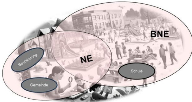
Abbildung 1: Partizipative Beteiligung untersch. AkteurInnen der Schule, Gemeinde und Bevölkerung

Hinter dem Kartenset steht die Grundidee, ein Schulhausareal als vielfältigen Lern-, Lebens- und Begegnungsraum zu begreifen, in Richtung einer Nachhaltigen Entwicklung gemeinsam umzugestalten und langfristig gemeinsam zu pflegen. Diese Umgestaltung erfolgt daher in einem partizipativen Prozess unter Beteiligung unterschiedlicher Akteur:innen der Schule (Schulleitung, Lehrpersonen, Schüler:innen), der Gemeinde (Gemeinderat, Hauswart:in, etc.) sowie der Bevölkerung